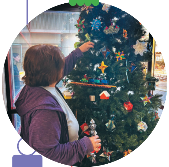
Des ornements en origami créés au fil des 30 dernières années ornent un arbre au Shriners Children's New England.

Cette activité a été un moment fort de la saison, et tous espèrent que la tradition se poursuivra dans les années à venir. 🎄