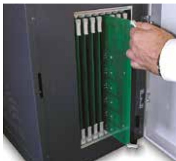
Leichter Zugriff auf Regelkarten